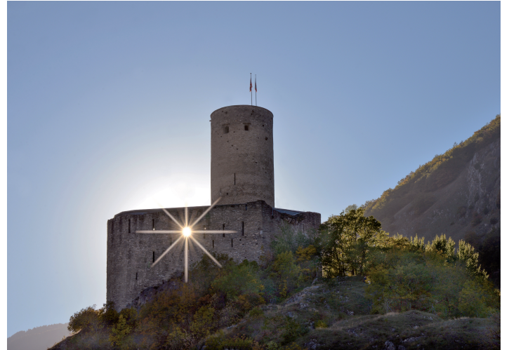
Château de la Bâtiaz