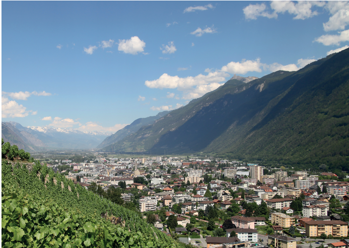
Vue sur martigny